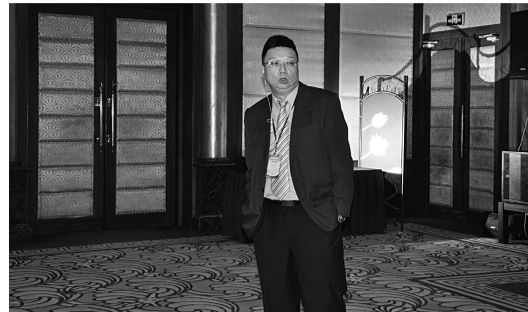
三、圣约翰科技大学的作法

圣约翰科技大学自创校以来,即在业界中有“务实”“创新”的评价,历经教改的变化,此教育中心思想始终不变,与其他传统大学与一般科技大学的差异如下图(见图2)。 以创新育成中心而言,近年在各领域均培养出具备国际知名度的中小企业,例如电动机车发展中心,或是子村庄园 CHARM VILLA 的小金鱼茶包,这些企业透过圣约翰的人力系统孵化,在兼顾质量与成本的情况下,得以大幅度发展。