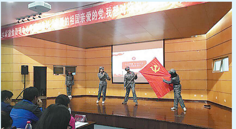
11月15日,由宿舍管理中心党建工作站主办的主题为“亲爱的祖国亲爱的党,我想对您说”经典歌曲大赛暨颁奖典礼在锦程楼(招办)101举行。音乐学院声乐173班、土木171班获得团体一等奖;经管学院174获得个人一等奖。学生记者 李江勇 摄影 学生宿舍管理中心党建工作站