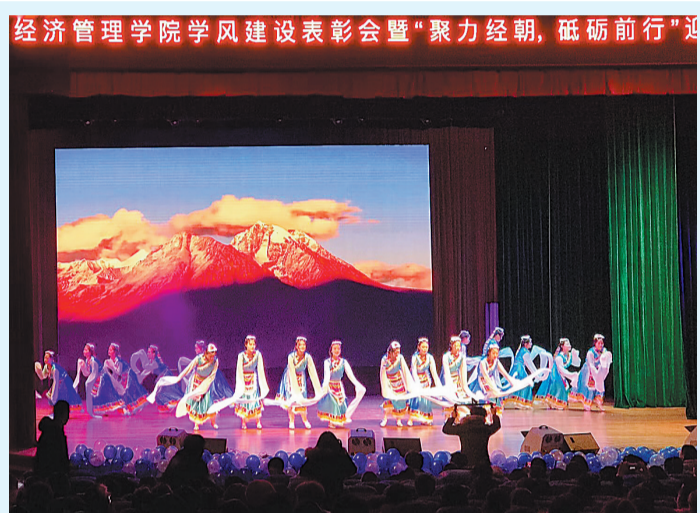
又到岁末,各学院的迎新晚会精彩纷呈,纷纷以鲜明的主题,独具的特色吸引着学子们的眼球。图为经管学院的迎新晚会。