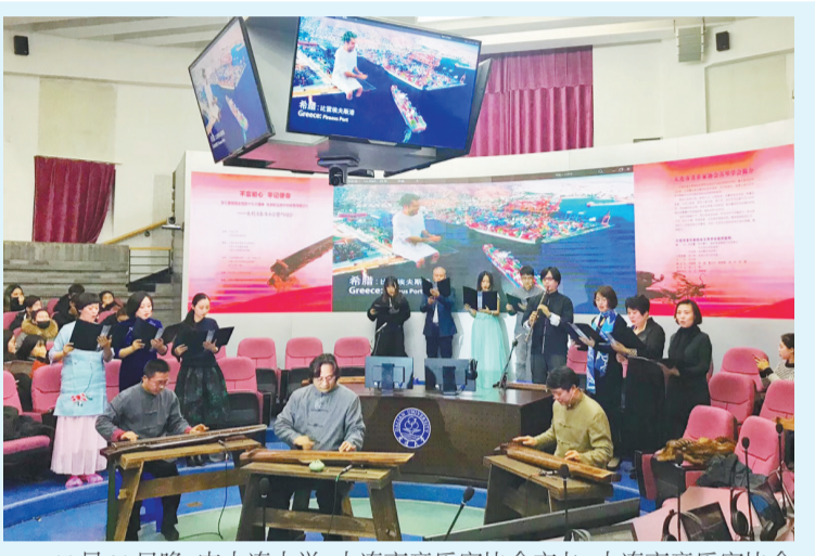
11月30日晚,由大连大学、大连市音乐家协会主办,大连市音乐家协会古琴学会、大连大学党委宣传部承办的大连市音乐家协会古琴学会大连大学专场演出在我校校博学楼同声传译厅举行,二百余名师生到场欣赏。