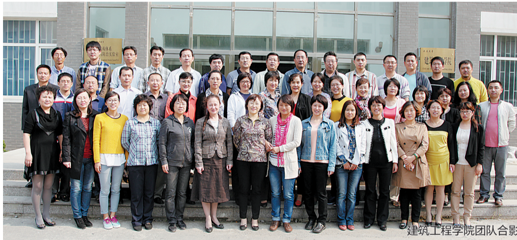
建筑工程学院团队合影

社会服务是高校的第三大职能,既是高校学术水平和技术水平的重要标志和提升途径,也是高校回报社会、服务社会的价值体现。建筑工程学院历来重视社会服务工作,早在学院办学初期的1985年就设立了大连大学建筑设计室,开创了与教学、科研相结合的社会服务工作新领域。