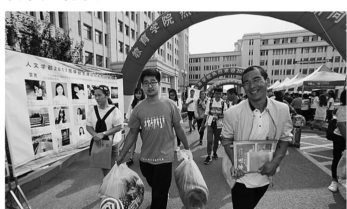
志愿者们热情帮助新生及家长。