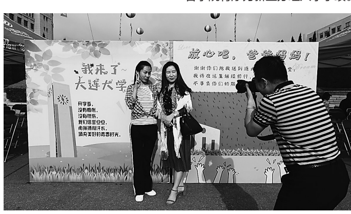
新生和家长在学院展板前合影留念。