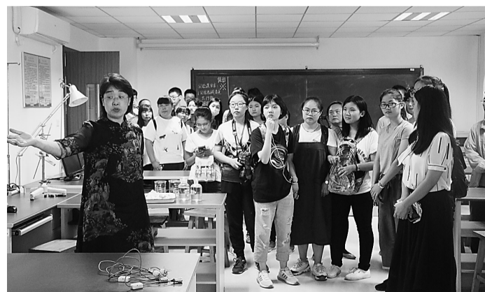
8月31日,学校图书馆、博物馆及各学院实验院开放,图为新生和家长参观医学院实验室。